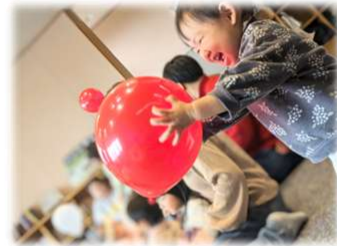
今月のワンショット えいごであそぼ！ Peek-a-boo