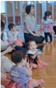
手づくりマラカスをフリフリ