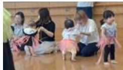
鈴やタンバリン等、楽器に触れて見たよ