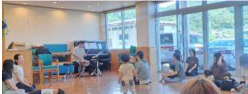
打楽器のソロ演奏に釘付け…

赤ちゃんたちはピアノや打楽器の音に興味津々で、だっこされながら演奏に合わせて動きながらノリノリで聴いている姿も…♪親子で生の音楽に触れ、楽しいひと時が過ごせました。