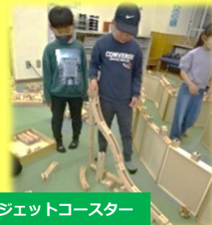
ジェットコースター